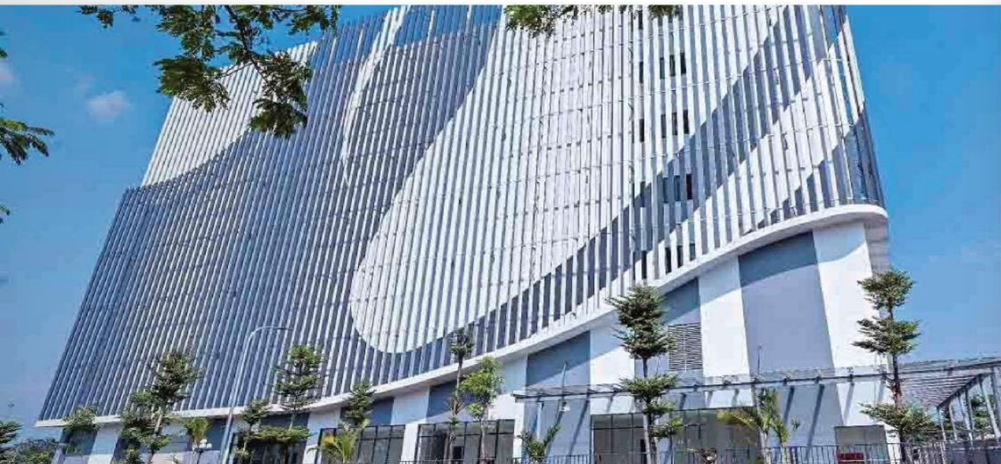
PROJECT FOR DATA CENTER VNPT_HA NOI