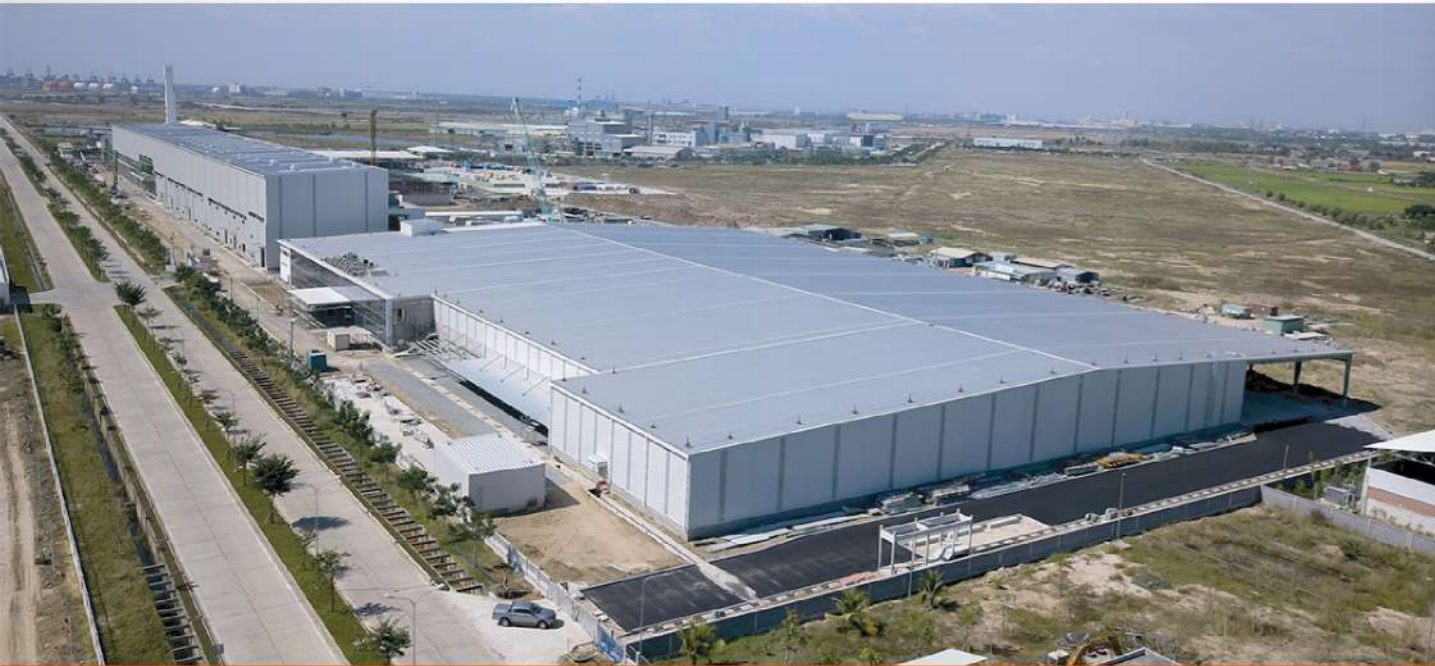
PROJECT FOR JAPAN MARUBENI_VUNG TAU