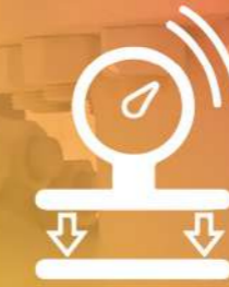
SENSOR & GAUGE

PROVIDING PRODUCT SOLUTIONS FOR INSTALLATION ON PIPELINES