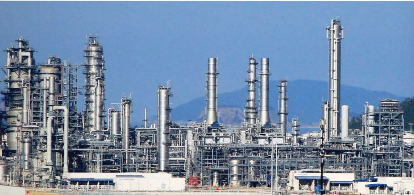
PROJECT FOR HEAVY INDUSTRY NGHI SON_PETROCHEMICAL REFINERY