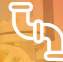
ACCESSORY & FITTING