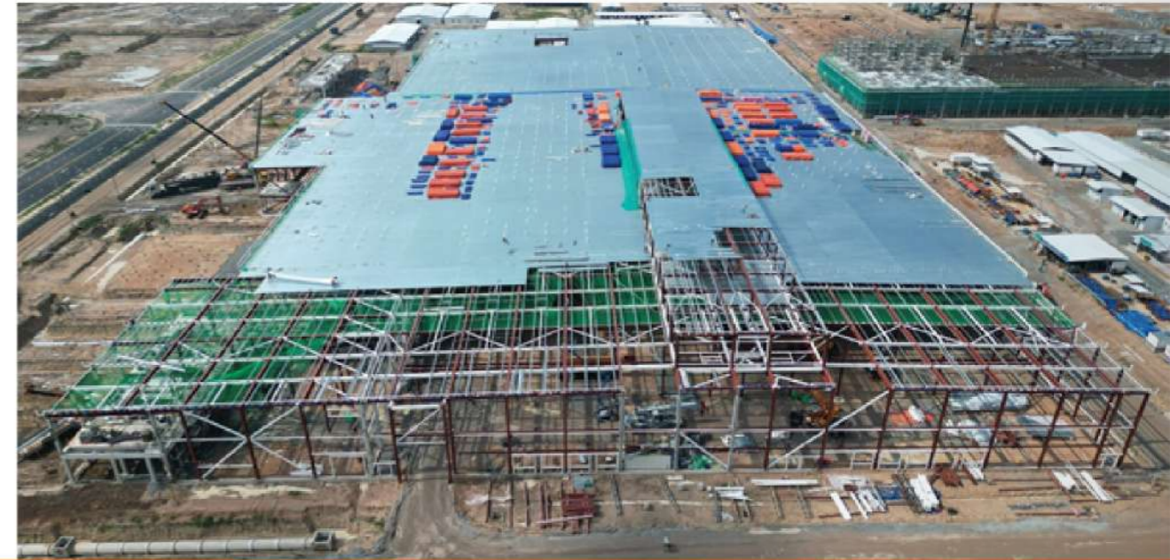
PROJECT FOR FDI LEGO_BINH DUONG