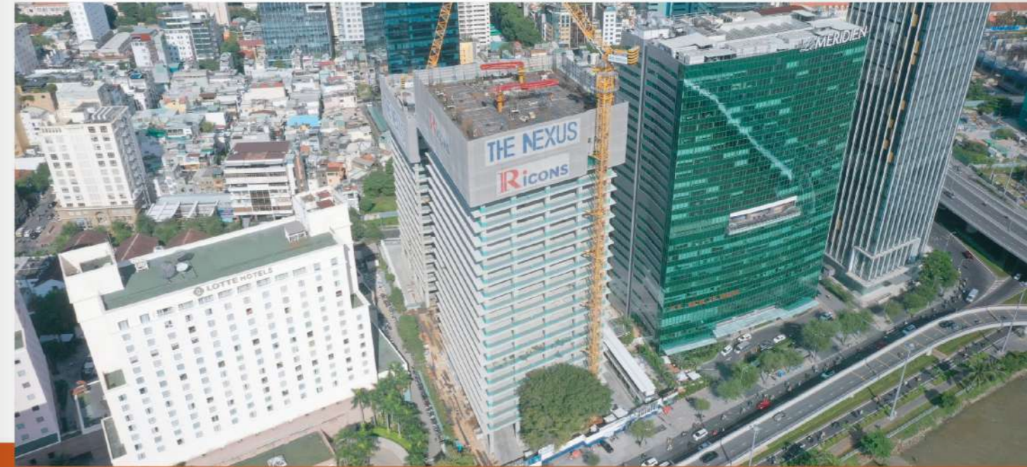
PROJECT FOR BUILDING THE NEXUS_HO CHI MINH