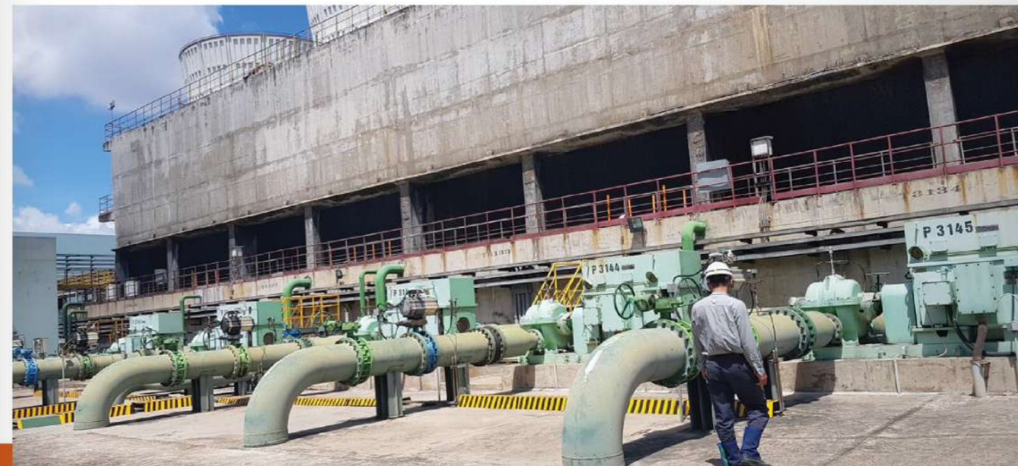
PROJECT FOR OVERSEAS PURSAT_CAMPUCHIA